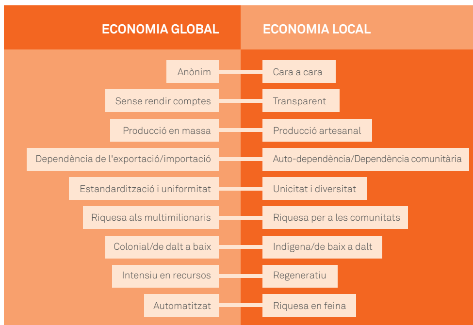
Figures 1 i 2. Diferències entre l'economia local i la global, i iniciatives de localització dels principals sectors econòmics.

Localització no significa, per tant, aïllament. Les economies localitzades són un reflex de les seves cultures, els seus recursos i les seves necessitats, però també promouen el lliure intercanvi d'informació a través de les fronteres. Es localitzen les necessitats materials i es globalitzen les idees i el coneixement.