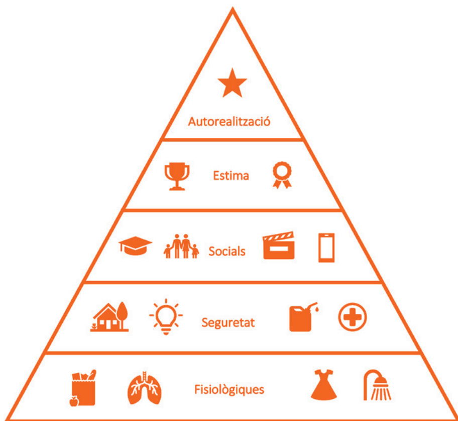
Figura 1. Piràmide de necessitats de Maslow

En qualsevol cas, queda palès que un salari digne va més enllà de la retribució directa per la feina i que cal tenir en compte el que es pot cobrir o no amb els diners rebuts.